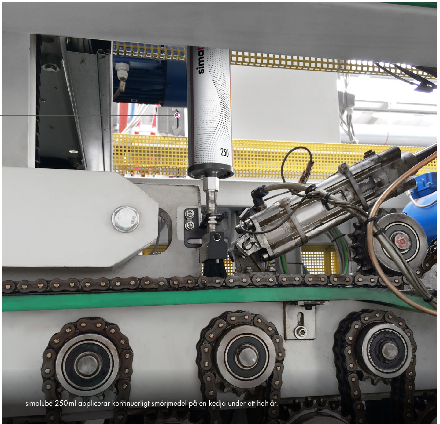
simalube 250 ml applicerar kontinuerligt smörjmedel på en kedja under ett helt år.