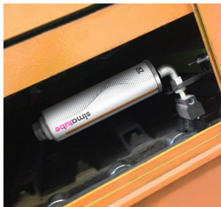
Transportörkedjan i en återvinningsfabrik smörjs och rengörs automatiskt med simalube och en borste.