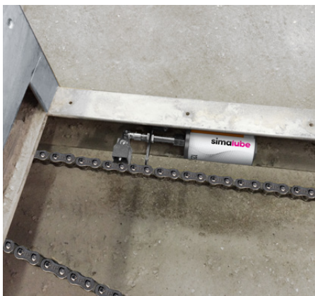
Vid behov kan simalube också monteras lutande.