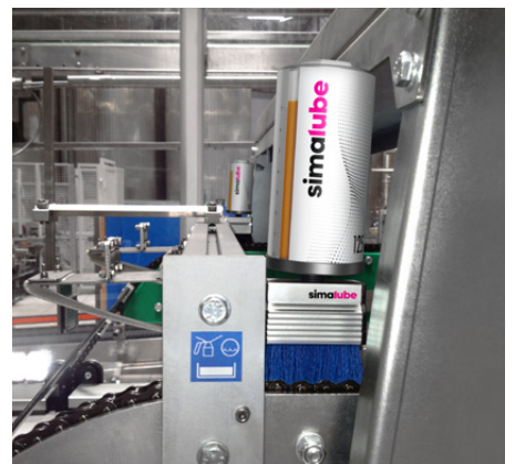
Två simalube med borste smörjer kedjan i ett bryggeri.