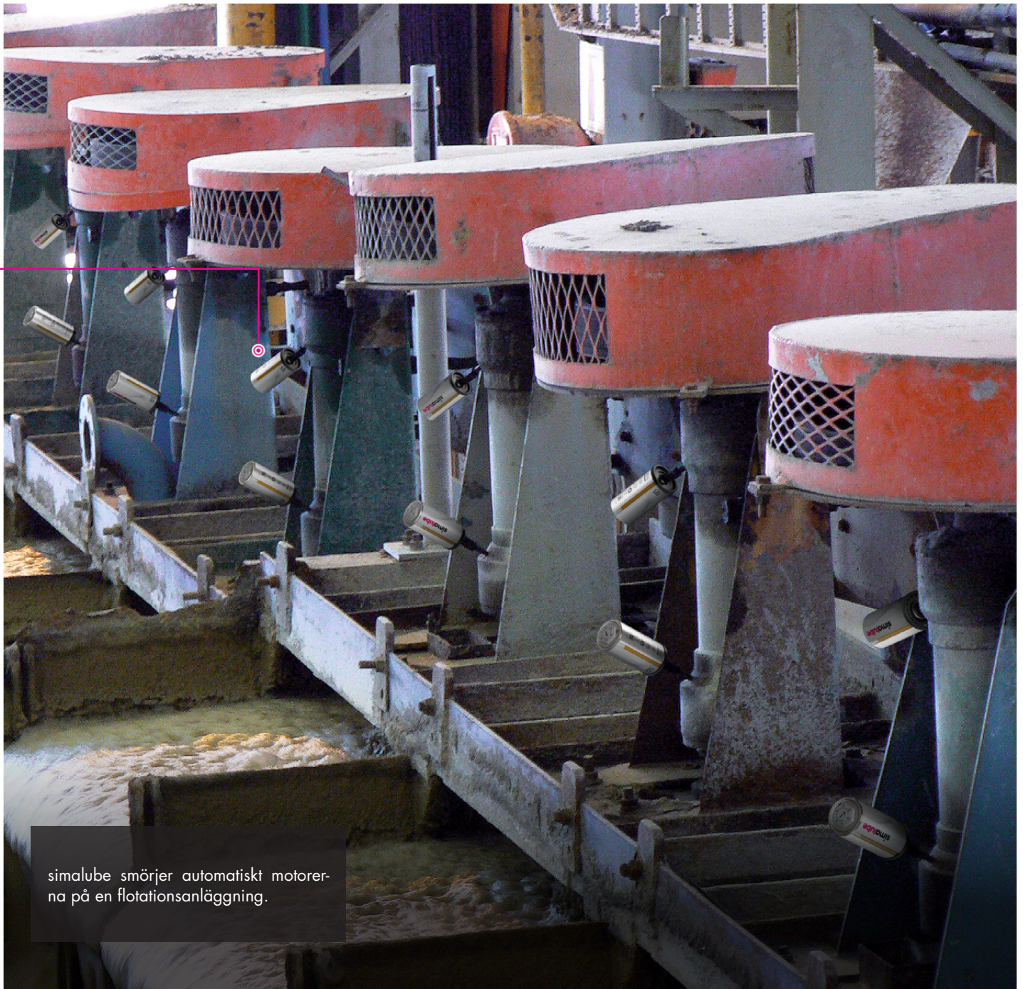
simalube smörjer automatiskt motorerna på en flotationsanläggning.