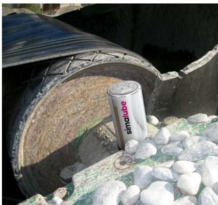
Remdrift smord med simalube.

«simalube minskar kostnaderna och ökar säkerheten på arbetsplatsen»