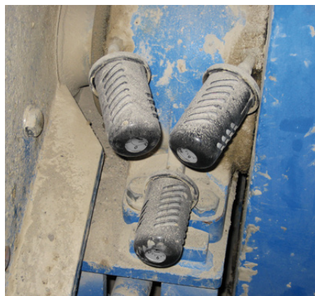
Skyddskåpor förhindrar att lubrikatorn skadas vid tuff yttre miljö.