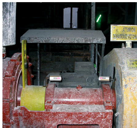
Lagersmörjning på huvuddrivaxeln på en filterpump.