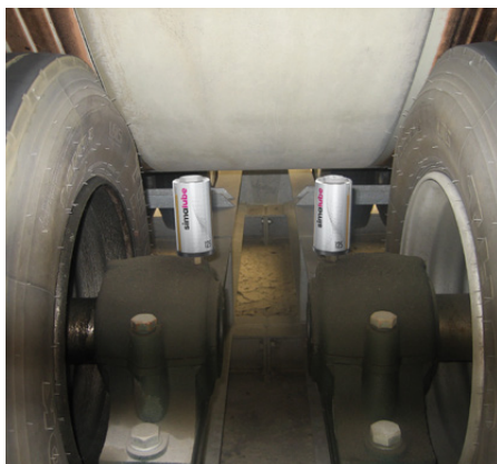
Lagerbockar på drev till transportband. Lubrikatorerna monteras direkt på lagret.