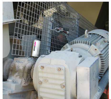
Smörjning av vertikallager på ett transportband.